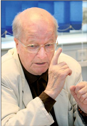
Prof. Jerzy Regulski, Prezes Fundacji Rozwoju Demokracji Lokalnej

W 2009 r. mija 20 rocznica rozpoczęcia prac nad reformą samorządową. Czy od początku było wiadomo, jaki model przyjmie reforma, czy też brano pod uwagę różne rozwiązania? Co zdecydowało o nadaniu reformie takiego, a nie innego kształtu?